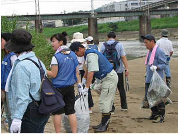
(大和川クリーンキャンペーン)

との言葉があるように、川を見ればその地域性が分かると言われています。当金庫では、行政の実施する河川の清掃活動への協力はもちろんのこと、金庫独自の清掃活動も行っています。多くの方が実際に河川のゴミ拾いを体験して初めて環境保護に対する意識が芽生えるのではないかと考えます。