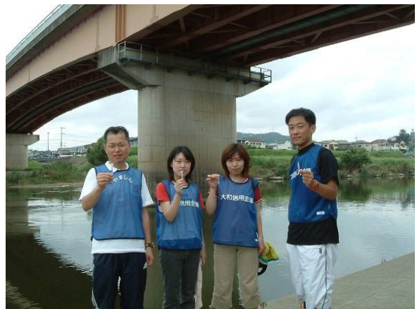
(大和川生活排水対策社会実験)

折しも、商品開発期間中に「大和川生活排水対策社会実験」という大和川の水質悪化要因の 8 割ともいわれている生活排水の抑制を地域に呼び掛けるという社会実験に参加したのをきっかけに、「奈良県“暮らし”と“環境”フェア」のパネリストとして参加することとなりました。