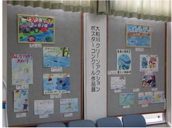
(大和川ポスターコンクール)

また、「大和川ポスターコンクール」では、同じく子どもたちに啓発用のポスターを描いてもらい、優秀な作品を表彰しました。