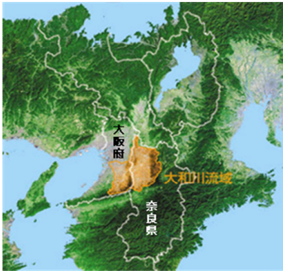
* 茶色の部分↑が大和川流域

その際、未だ企画中であり、機関決裁も取っていないこの預金商品の取り扱い開始を、来場者の皆さんの前で発表してしまいました。いかにもフライングでしたが、後は勢いでなんとか商品化まで持っていきました。