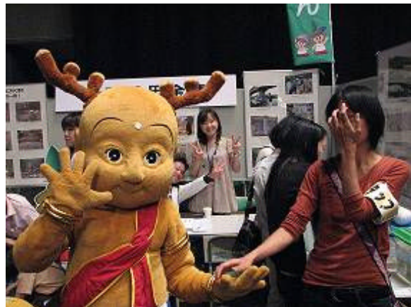
(奈良県環境フェア・せんとくん登場)

環境問題は、何よりも一人ひとりの意識付けが重要です。これらの取り組みは、大和川という地元を流れる河川の水質改善を地域住民に意識していただき、地域の環境保全を住民みんなで図っていくという、地域に根差した金融機関ならではの取り組みであるといえます。