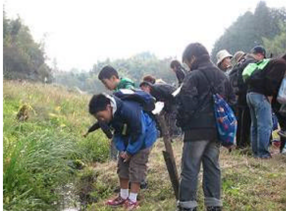
(ふるさと大和川源流体験ツアー)

例えば、地域の NPO 団体との協働により「ふるさと大和川源流体験ツアー」を開催し、子どもたちが大和川の源流を体験することによって、自然環境の大切さを学んでもらっています。