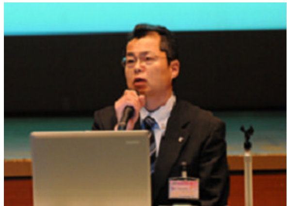
(大和信用金庫 新さん)

地球温暖化問題のような全世界的な課題よりも、地域住民に関心を持ってもらえ、課題解決のために意識を高め合い、みんなで協力していけるような取り